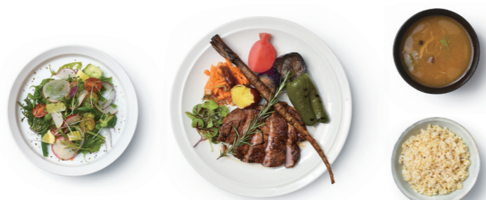
本日の定食 ¥1,000 (~14:00まで)