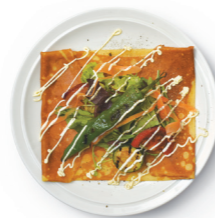
ロースハム & CHEDDARチーズ & グリル野菜のクレープ ¥900