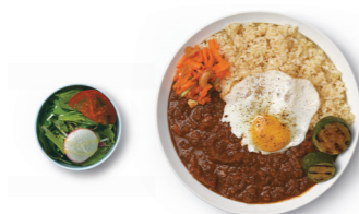
本日のカレー ¥1,000 半熟目玉焼きのせ +¥100