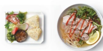
本日のフォー ¥800 おにぎり & サラダセット ¥1,000