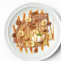
塩バターキャラメル ソース & バナナのクレープ single ¥800 double ¥1,000

ベジタブルケーキ 本日のケーキ ..... ¥600 季節のデザート 本日のデザート ..... ¥750