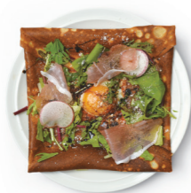
自家製トマトソース & 半熟目玉焼き & 生ハムのクレープ ¥900