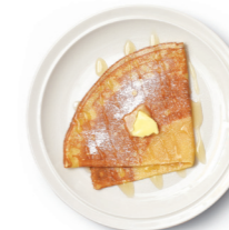
自家製バター & 日本みつばちの蜂蜜のクレープ single ¥800 double ¥1,000