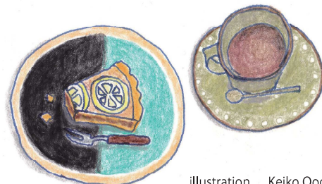
illustration Keiko Oogami